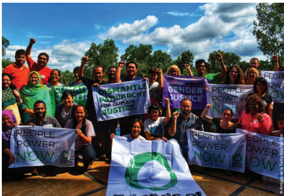
AGA de Amigos de la Tierra Asia Pacífico en Bangladesh.

Amigos de la Tierra Asia Pacífico ha venido fortaleciéndose más y más. Este año la región tuvo la ventaja de poder contar con tres personas contratadas a tiempo parcial, que se encargan de los temas de los grupos miembro, los proyectos y las comunicaciones. Tener una persona dedicada a las comunicaciones hizo una gran diferencia que posibilitó el contacto con comunicadoras/es de cada grupo miembro y que compartieran contenidos en las redes sociales.