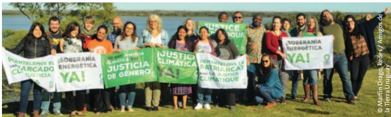
Arriba: AGA de Amigos de la Tierra América Latina y el Caribe en Punta Gorda, Nueva Palmira, Uruguay.

ATALC organizó en mayo en el Parlamento uruguayo en Montevideo un Seminario Regional sobre “Empresas transnacionales, demandas contra Estados y captura de la Democracia”, como parte del trabajo por el Tratado Vinculante. Fue un proceso de articulación, coordinación y construcción de movimiento regional en pos de la aprobación del Tratado Vinculante, que se enfocó en la ‘captura corporativa’ y las demandas de arbitraje de inversiones interpuestas por empresas transnacionales contra Estados (ver sección de JERN, página 11).