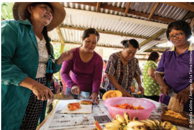
Arriba: Programa de sensibilización y capacitación en agroecología para mujeres en el Centro de Agroecología y Agro-silvicultura de Sahabat Alam Malaysia/Amigos de la Tierra Malasia en Marudi, Sarawak.