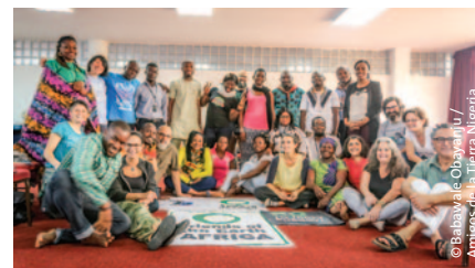
Abajo derecha: AGA de Amigos de la Tierra África en Maputo, Mozambique.