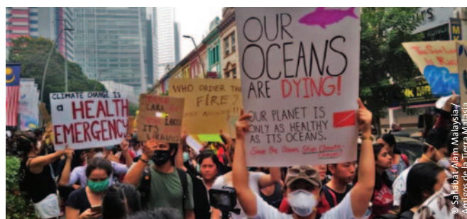
Reclamando el fin de los combustibles fósiles y exigiendo una transición justa a energías renovables en Penang, Malasia.

Presionamos para que la lucha contra la compensación y los mercados de emisiones de carbono fueran el tema principal en la COP, garantizando una gran cobertura de prensa para nuestros análisis y consiguiendo la adhesión de 174 organizaciones a nuestra petición “No a los mercados de emisiones de carbono”. La buena noticia es que nuestros esfuerzos contribuyeron a evitar que se llegara a un acuerdo sobre los mercados de emisiones de carbono en Madrid. El impulso que generamos en contra de esta peligrosa distracción será crucial porque los mercados de emisiones de carbono volverán a estar sobre la mesa en la COP26.