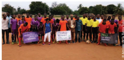
Amigos de la Tierra Togo organizó un partido de fútbol con niños de una comunidad para generar conciencia sobre los asuntos del clima.

Reconociendo el gran potencial que ofrecen los procesos judiciales para nuestras campañas, comenzamos un mapeo del trabajo de los grupos miembro en materia de litigios por el clima. Esa información la estamos utilizando para diseñar las estrategias y coordinar las actividades del próximo plan quinquenal.