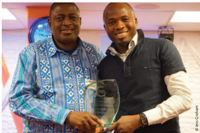
Arriba: Environmental Rights Action/Amigos de la Tierra Nigeria obtiene el Premio Ciudades Transformadoras en la categoría Agua.

En 2019, Amigos de la Tierra Internacional se incorporó como colaborador oficial del Premio Ciudades Transformadoras. Este mecanismo singular recopiló y conectó 33 historias de iniciativas lideradas por las comunidades en torno al agua, energía, alimentos y vivienda de 24 países –entre ellas, cuatro iniciativas de grupos de Amigos de la Tierra y aliados. Estos premios atrajeron gran atención de los medios y 6000 personas votaron por su iniciativa favorita. Environmental Rights Action / Amigos de la Tierra Nigeria ganó un premio por su campaña por el derecho al acceso público al agua en Lagos, y pudieron en consecuencia reunirse con y aprender de agentes de cambio social en una conferencia mundial de Ciudades Transformadoras. Este mecanismo es una oportunidad para que gobiernos locales, coaliciones municipales, movimientos sociales y organizaciones de la sociedad civil compartan experiencias sobre la construcción de soluciones y, fundamentalmente, para inspirar a otras/os.