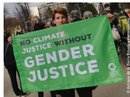
Amigos de la Tierra Bosnia y Herzegovina en las calles en el Día Internacional de las Mujeres 2019.

Nuestro año fiscal de 2019 culminó justamente mientras surgía la amenaza de propagación del COVID-19. Más allá de sus impactos estremecedores para la salud, la pandemia tiene profundas consecuencias para los temas en los que trabajamos y para nuestros aliados, grupos y comunidades. Pero hemos demostrado nuestra capacidad para organizarnos, movilizarnos y hacerles frente a las crisis socio-ecológicas que enfrenta la humanidad y luchar por poder popular, los derechos colectivos y la justicia de género y contra el patriarcado. Es con renovadas energías entonces que reafirmamos nuestro compromiso con la lucha.