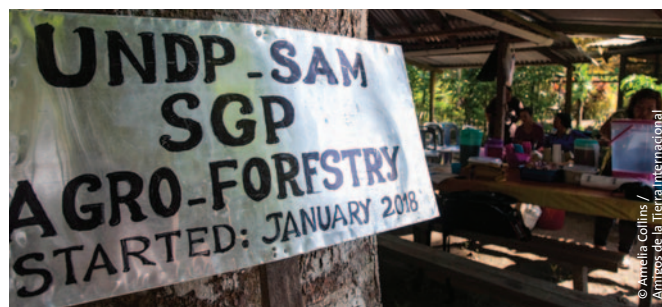
Centro de Agroecología y Agro-silvicultura de Sahabat Alam Malaysia/Amigos de la Tierra Malasia en Marudi, Baram, Sarawak.

Al mismo tiempo, continuamos desarrollando un análisis basado en género acerca de nuestra incidencia en el Convenio, gracias a una relación más cercana con la Marcha Mundial de las Mujeres (MMM) y nuestro involucramiento en el Círculo de Mujeres.