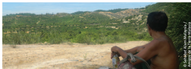
© Sahabat Alam Malaysia / Amigos de la Tierra Malasia