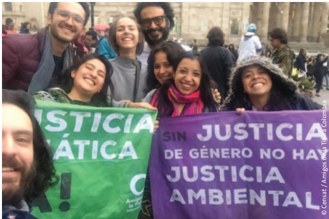
Reclamando el fin de los combustibles fósiles y exigiendo una transición justa a energías renovables en Colombia.