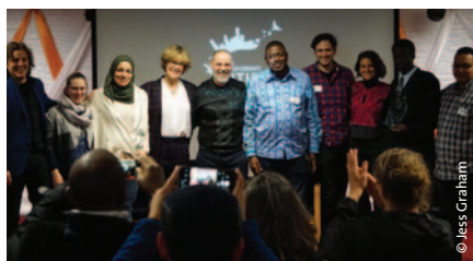
Derecha: Finalistas para el Premio Ciudades Transformadoras, incluidos Pengon/Amigos de la Tierra Palestina y Environmental Rights Action/Amigos de la Tierra Nigeria.