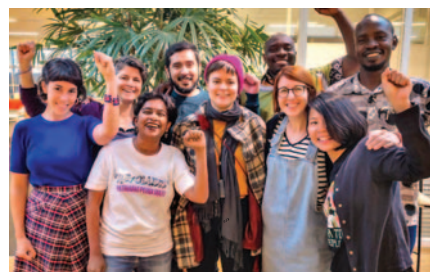
De arriba hacia abajo: Comité Ejecutivo de Amigos de la Tierra Internacional.