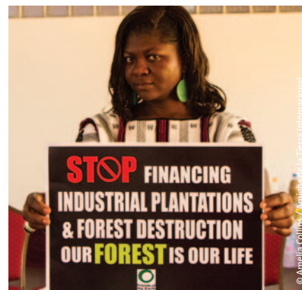
© Amelia Colina / Amigos de la Tierra Internacional