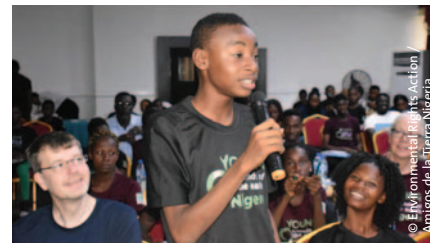
Izquierda y arriba derecha: Primera Escuela de la Sustentabilidad de Jóvenes Amigos de la Tierra Nigeria.