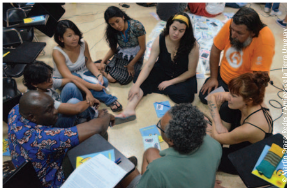
Derecha: Escuela de la Sustentabilidad de Amigos de la Tierra América Latina y el Caribe en 2019 en La Habana, Cuba.