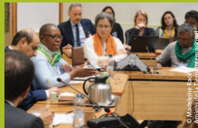
Miembro de La Vía Campesina toma la palabra ante el Comité de la ONU para la Seguridad Alimentaria Mundial reunido en Roma.

Este fue un período en el que vimos cómo las grandes empresas del agronegocio intensificaron sus intentos de maquillar de verde su modelo y aumentar sus ganancias y control del sistema agroalimentario. El análisis de dichas estrategias, que realizamos con el Transnational Institute y Crocevia, estará disponible en 2020. Nosotras/os y nuestros aliados seguimos profundamente comprometidos para conseguir que las/os formuladores de políticas se enfoquen en soluciones verdaderas.