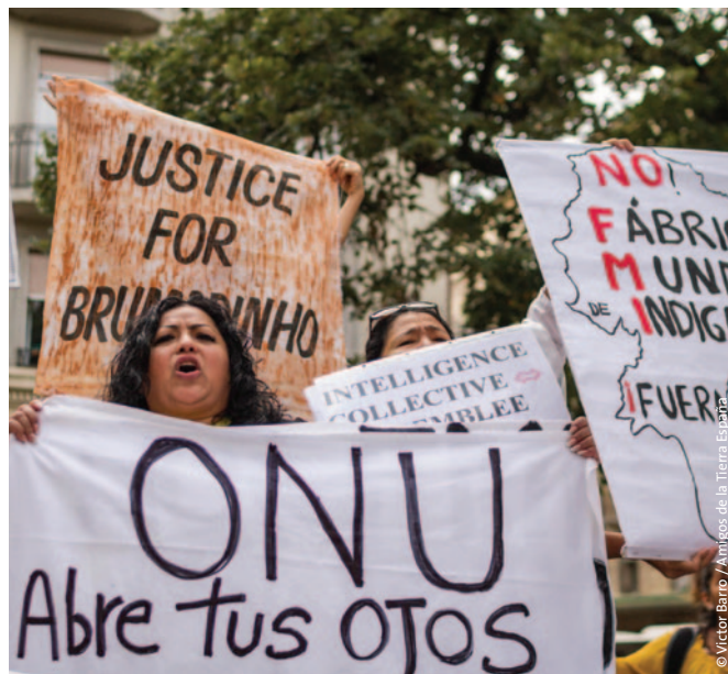
Juntas con aliados/as en las calles de Ginebra denunciando la impunidad empresarial y exigiendo justicia climática.

En 2019, los grupos de Asia Pacífico trabajaron intensa y coordinadamente en torno a la Iniciativa de la Franja y la Ruta (BRI, por sus siglas en inglés) de China, cuyos efectos se están sintiendo en toda la región y más allá. Los grupos produjeron un informe que explica la BRI, el trasfondo regional y las interrogantes y oportunidades que representa para nuestro trabajo.