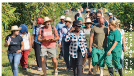
Derecha: 7° Encuentro Internacional de Agroecología de La Vía Campesina, Cuba.