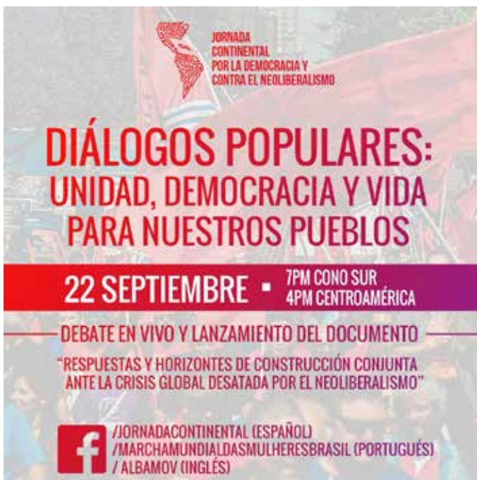
■ Pie de foto: Jornada Continental por la Democracia y contra el Neoliberalismo.

El debate público, en el que participaron varios representantes de organizaciones populares que integran la Jornada Continental, sirvió también a la Jornada para lanzar su documento “Respuestas y horizontes de construcción conjunta ante la crisis global desatada por el neoliberalismo” . Además, se presentó la agenda común de actividades y movilizaciones para octubre y noviembre.